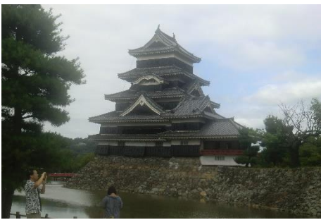
松本城。国宝で現存天守の一つです。混んでいて、登閣は出来ませんでした。