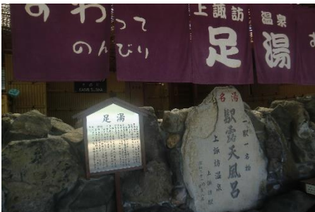
上諏訪駅内足湯。上諏訪駅内では無料で入れる足湯があります。足の疲労が取れました。