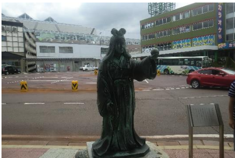
奴奈川姫像。奴奈川姫とは 712 年に作成された古事記に出てくる伝説の神です。ただ 720 年に作成された日本書紀には出てきません。