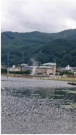
諏訪湖。白鳥の遊覧船に乗りました。