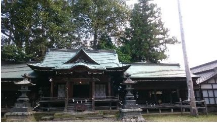
諏訪大社上社本宮。境内最古の櫓があった。