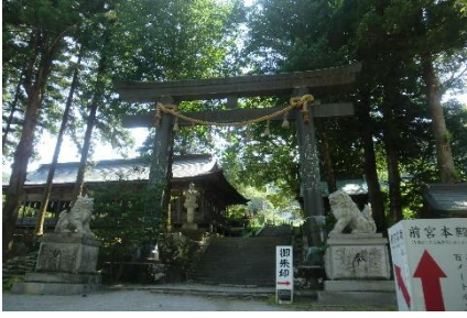
諏訪大社前宮。名水、「水眼」が流れていました。