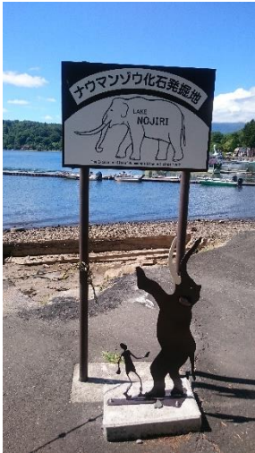
ナウマンゾウ発掘地。現在も数年おきに、発掘調査があります。