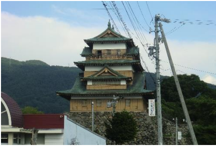
諏訪高島城。「諏訪の浮き城」の異名を持ちます。昔は諏訪湖のすぐ近くにありました。