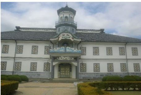
旧開智学校。明治時代初期の和洋折衷の学校です。和洋折衷であったことから、当時の日本には欧米の技術が完璧には伝わってなかったことが分かりました。