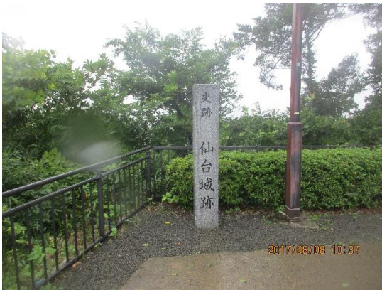
仙台城跡の石碑です。雨が強かったです。