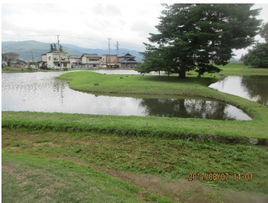
無量光院跡。かつてここには藤原秀衡が作った寺院があった。