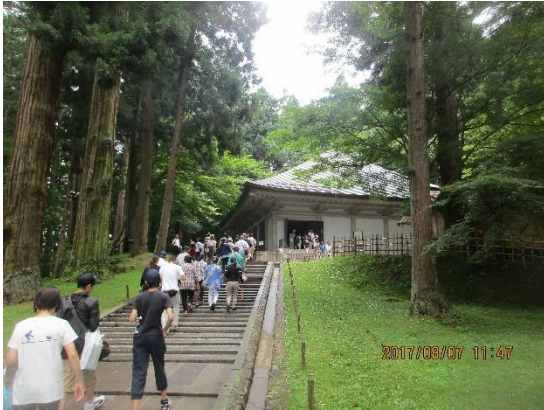
中尊寺金色堂。奥州藤原氏四代（清衡、基衡、秀衡、泰衡）の遺骸が納められています。（泰衡は首のみ。）