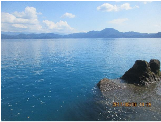
田沢湖の水は澄んでいてとても綺麗でした。