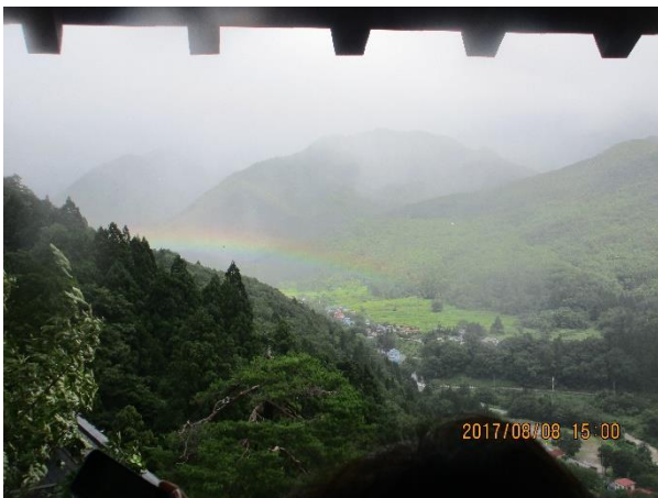
虹が見えました。山の奥から出る虹はとても綺麗でした。