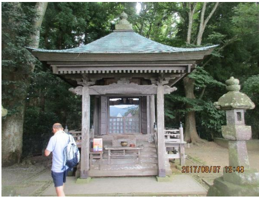
高館跡。藤原泰衡に裏切られた源義経は衣川の戦いに敗れてここで自害して果てました。