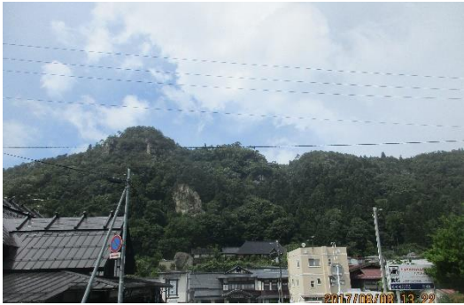
山寺（立石寺）です。険しい山崖にお堂などがありました。