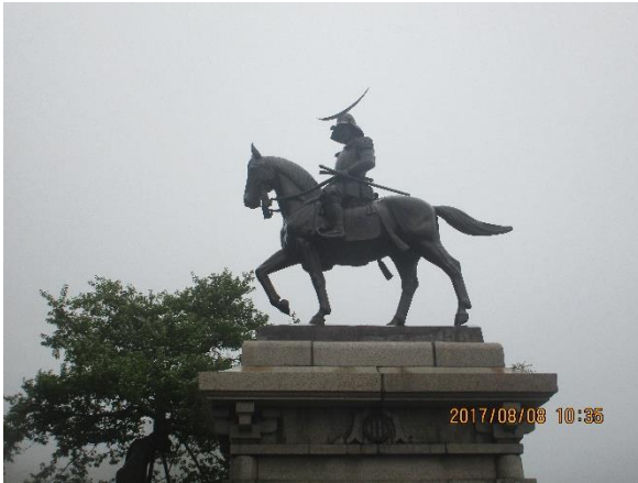
仙台城跡の伊達政宗像です。猛々しい銅像でした。