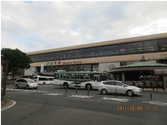
初日は盛岡駅前のホテルに泊まりました。