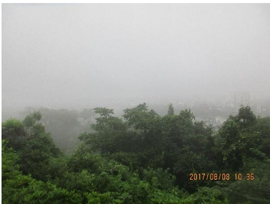
仙台城から住宅街を見てみましたが、霧でよく見えませんでした。 残念！