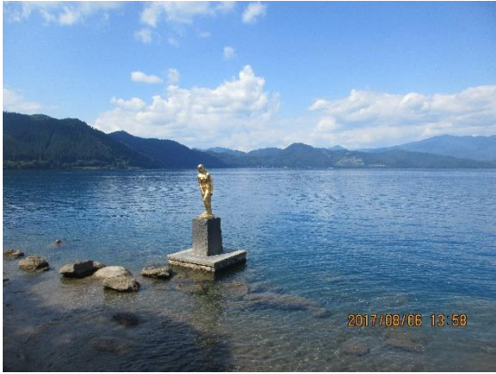
田沢湖にあるたつこ像。金色に輝いていました。