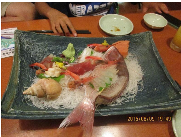
富山県内の居酒屋の寿司です。きとくとで美味しかったです。