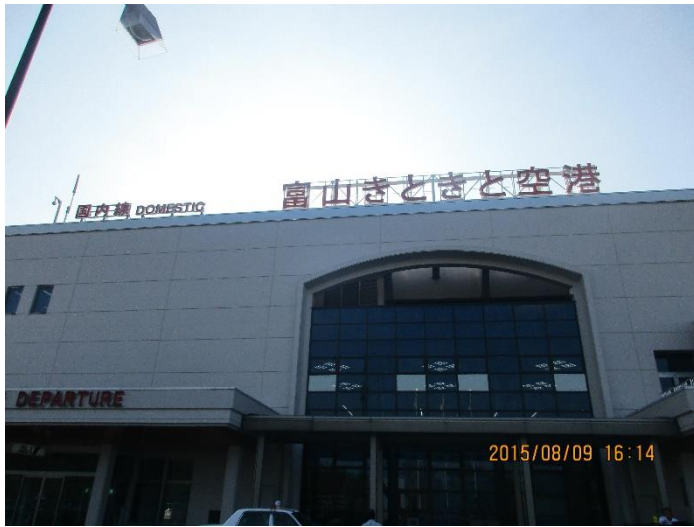
富山きとくと空港。きとくととは富山県の方言で「新鮮」を意味しています。