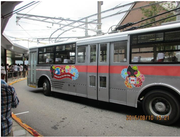
帰りのトロリーバスです。明るいので電線がよく見えます。