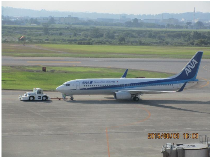
ANAの飛行機が飛ぶ準備をしています。