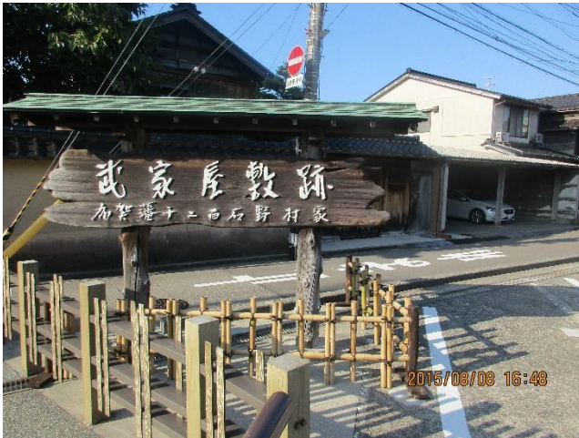
加賀藩士たちの屋敷跡です。百万石の武家屋敷町はとても大きかったです。