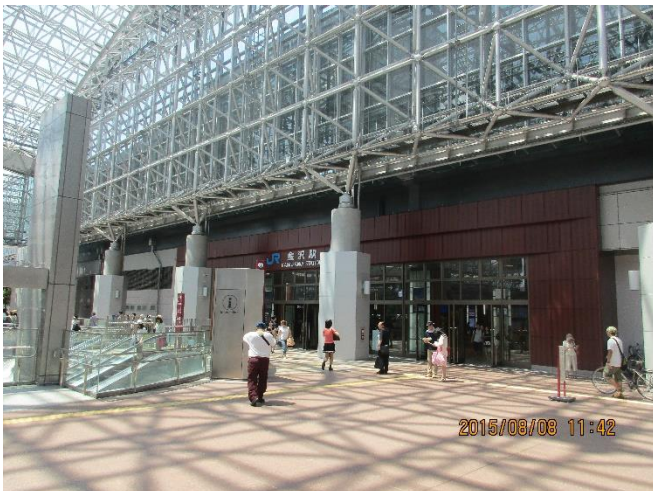
金沢駅。最近走り始めた北陸新幹線に乗りました。 二日目