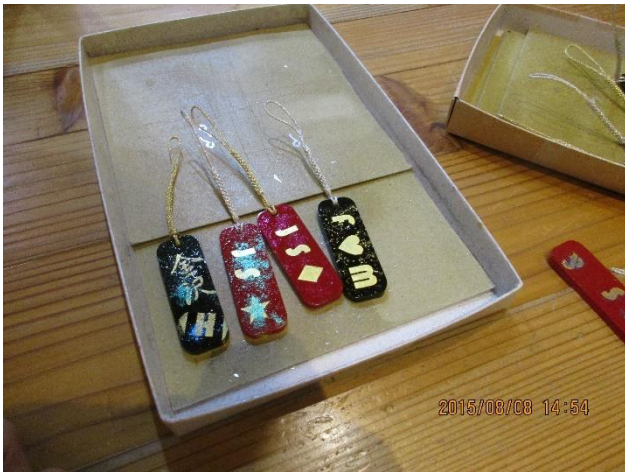
金箔貼り体験。金沢は金箔の名産地です。